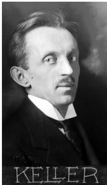
Oswald Keller, Künstlerpostkarte ca. 1918

Oswin Keller können bei mindestens sieben weiteren Firmen insgesamt 351 Rollen nachgewiesen werden, davon 305 verschiedene Werke (einige Werke erschienen bei mehreren Firmen).